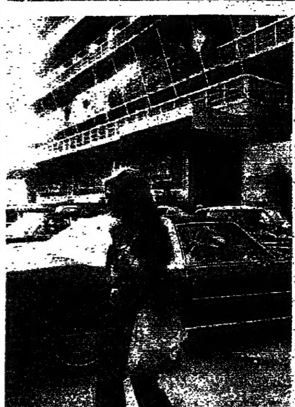
داليدا تسيير جربة ليام غسق . انسان جورج

داليدا ، تركت الاغنية ، وفتت بعد ظهر امس ، الى الاسواق المهيجة ومنطقة اللضاف .